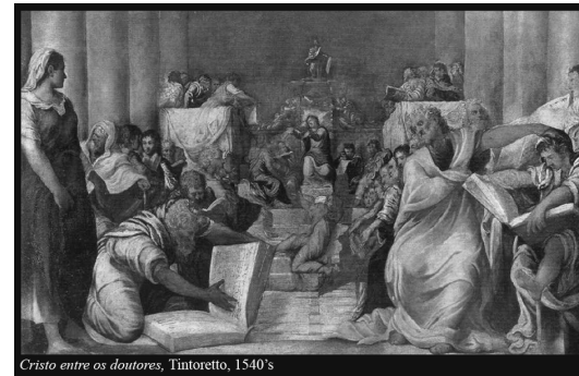
Cristo entre os doutores, Tintoretto, 1540's

A liturgia do 27º Domingo do Tempo Comum utiliza a imagem da “vinha de Deus” para falar desse Povo que aceita o desafio do amor de Deus e que se coloca ao serviço de Deus. Desse Povo, Deus exige frutos de amor, de paz, de justiça, de bondade e de misericórdia. Na primeira leitura, o profeta Isaías dá conta do amor e da solicitude de Deus pela sua “vinha”. Esse amor e essa solicitude não podem, no entanto, ter como contrapartida frutos de egoísmo e de injustiça... O Povo de Jahwéh tem de deixar-se transformar pelo amor sempre fiel de Deus e produzir os frutos bons que Deus aprecia – a justiça, o direito, o respeito pelos mandamentos, a fidelidade à Aliança. No Evangelho, Jesus retoma a imagem da “vinha”. Critica fortemente os líderes judaicos que se apropriaram em benefício próprio da “vinha de Deus” e que se recusaram sempre a oferecer a Deus os frutos que Lhe eram devidos. Jesus anuncia que a “vinha” vai ser-lhes retirada e vai ser confiada a trabalhadores que produzam e que entreguem a Deus os frutos que Ele espera. Na segunda leitura, Paulo exorta os cristãos da cidade grega de Filipos – e todos os que fazem parte da “vinha de Deus” – a viverem na alegria e na serenidade, respeitando o que é verdadeiro, nobre, justo e digno. São esses os frutos que Deus espera da sua “vinha”.