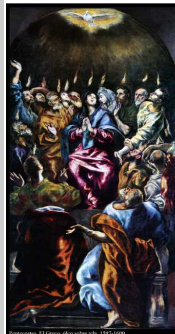
Pentecostes, El Greco, óleo sobre tela, 1597-1600

O tema deste domingo é, evidentemente, o Espírito Santo. Dom de Deus a todos os crentes, o Espírito dá vida, renova, transforma, constrói comunidade e faz nascer o Homem Novo.