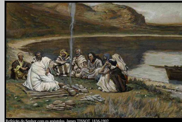
Refeição do Senhor com os apóstolos. James TISSOT, 1836-1902

A liturgia deste 3º Domingo do Tempo Pascal recorda-nos que a comunidade cristã tem por missão testemunhar e concretizar o projeto libertador que Jesus iniciou; e que Jesus, vivo e ressuscitado, acompanhará sempre a sua Igreja em missão, vivificando-a com a sua presença e orientando-a com a sua Palavra.