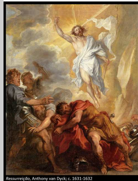
Ressurreição, Anthony van Dyck; c. 1631-1632

A liturgia deste domingo celebra a ressurreição e garante-nos que a vida em plenitude resulta de uma existência feita dom e serviço em favor dos irmãos. A ressurreição de Cristo é o exemplo concreto que confirma tudo isto.