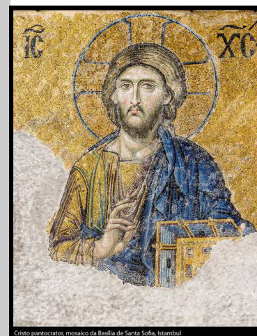
Cristo pantocrator, mosaico da Basílica de Santa Sofia, Istambul

A liturgia do 24º Domingo do Tempo Comum diz-nos que o caminho da realização plena do homem passa pela obediência aos projetos de Deus e pelo dom total da vida aos irmãos. Ao contrário do que o mundo pensa, esse caminho não conduz ao fracasso, mas à vida verdadeira, à realização plena do homem.