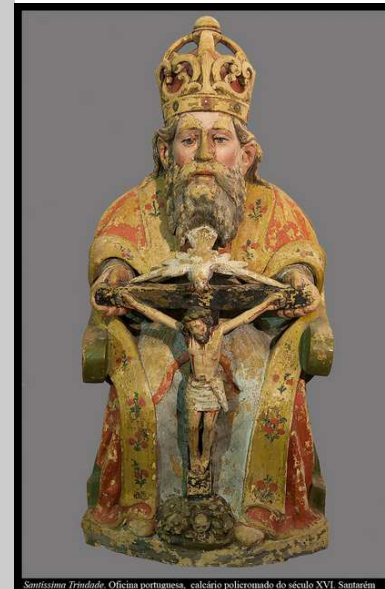
Santíssima Trindade. Oficina portuguesa, calcário policromado do século XVI. Santarém

A Solenidade que hoje celebramos não é um convite a decifrar o mistério que se esconde por detrás de “um Deus em três pessoas”; mas é um convite a contemplar o Deus que é amor, que é família, que é comunidade e que criou os homens para os fazer comungar nesse mistério de amor.