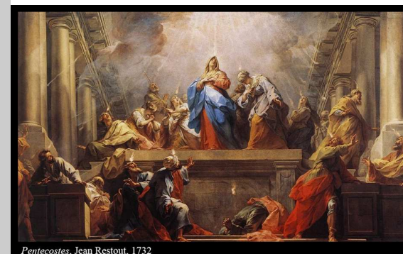
Pentecostes, Jean Restout, 1732

O tema deste domingo é, evidentemente, o Espírito Santo. Dom de Deus a todos os crentes, o Espírito dá vida, renova, transforma, constrói comunidade e faz nascer o Homem Novo.