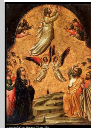
Ascensão de Cristo, Guiseppe D'Aglio, c.1344

A Solenidade da Ascensão de Jesus que hoje celebramos sugere que, no final do caminho percorrido no amor e na doação, está a vida definitiva, a comunhão com Deus. Sugere também que Jesus nos deixou o testemunho e que somos nós, seus seguidores, que devemos continuar a realizar o projeto libertador de Deus para os homens e para o mundo.