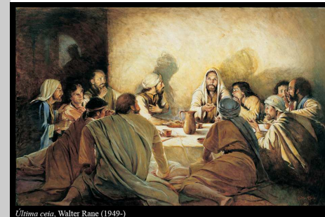
Última Ceia, Walter Rane (1949-)

A liturgia do 6º Domingo da Páscoa convida-nos a contemplar o amor de Deus, manifestado na pessoa, nos gestos e nas palavras de Jesus e dia a dia tornado presente na vida dos homens por ação dos discípulos de Jesus.